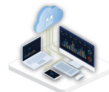
Sistema di monitoraggio