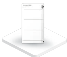
Batteria al litio ad alta tensione